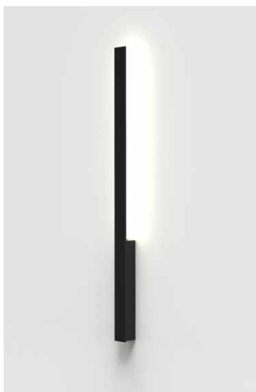
TK04-03 / 95 negro semimate