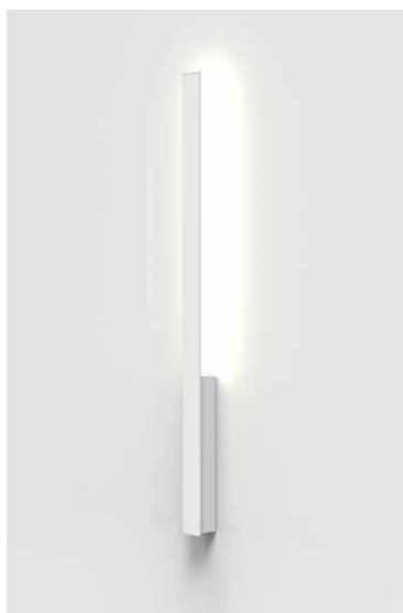
TK04-02 / 95 blanco semimate