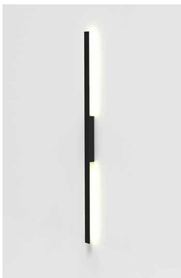
TK05-03 / 150 negro semimate