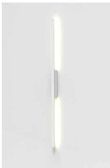
TK05-02 / 150 blanco semimate